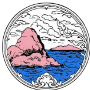
รูปภูเขาอยู่ริมทะเล

ทะเล หมายถึงความเป็นเมืองชายทะเลที่อุดมสมบูรณ์ภูเขา หมายถึงเขาสามมูข อันเป็นที่ตั้งของศาลเจ้าแม่สามมูขอันศักดิ์สิทธิ์ เป็นที่เคารพของชาวชลบุรี ตลอดจนประชาชนทั่วไป ซึ่งต่างมีความเชื่อตรงกันว่าศาลเจ้าแม่สามมูขสามารถดลบันดาลให้ความคุ้มครองผู้ที่มาเคารพกราบไหว้ให้พ้นจากภัยอันตรายต่างๆได้ โดยเฉพาะการออกไปประกอบอาชีพจับปลาในท้องทะเล เขาสามมูขจึงกลายเป็นปูชนียสถานและสัญลักษณ์สำคัญยิ่งแห่งหนึ่งของชาวชลบุรีมาโดยตลอด